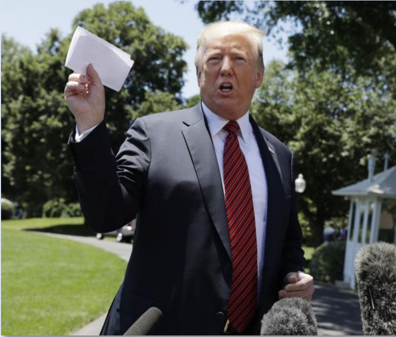
김정은 위원장, 트럼프 대통령에 친서 전달(6.10)