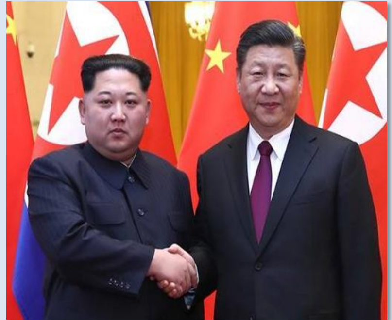
시진핑 주석 방북 예정(6.20-21)